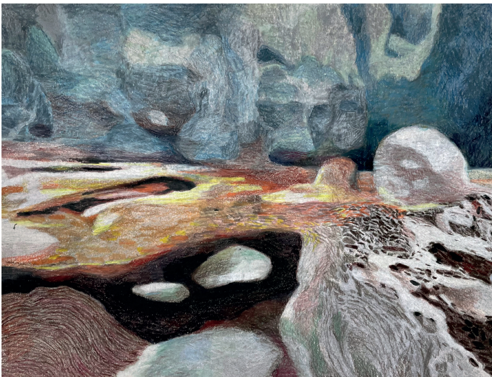
Kosmos XXII , kleurpotlood op papier gelijmd op dibond, 26 x 19 cm, 2024

www.ninetkaijser.nl insta@ninet_drawings