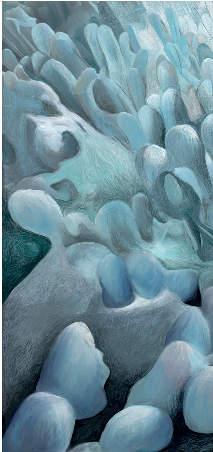
COLD LAND, digitale tekening, A4, 2021

'De lerarenopleiding was nogal ambachtelijk. Je leerde er verschillende technieken zoals aquarelleren, dieren tekenen, grafiek en modeltekenen. Ik heb er heel veel van opgestoken en er een rijk gevulde gereedschapskist aan overgehouden. Uiteindelijk ben ik met grafiek afgestudeerd.