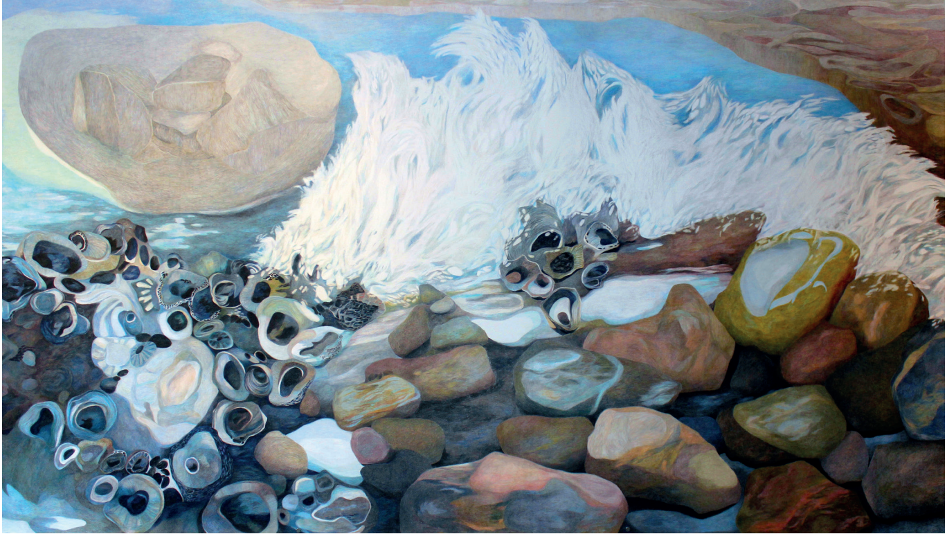
WAVE , kleurpotlood op papier, 337 x 196 cm, 2023

Kaijser is gefascineerd door de natuur. Tijdens haar reizen naar Noorwegen, Tenerife en Normandië fotografeerde ze onder meer boomwortels, oesters, korallen en fjorden, water en bergen. 'Ik bewerk mijn foto's een beetje op mijn iPad om er vervolgens prints van te maken waar ik overheen teken. De prints zijn een soort startpunt, een eerste vertrekpunt. Deze kleine werken (29 x 16 cm, MS ) maak ik in zogenaamd korte of snelle tijd, ze zijn in één dag klaar.' Haar kleine werken dienen als basis voor de grotere werken die ze maakt op papier, zoals de tekening WAVE die wel 337 x 196 cm meet. WAVE heeft ze gemaakt in langzame tijd, ze werkte er bijna een jaar aan.