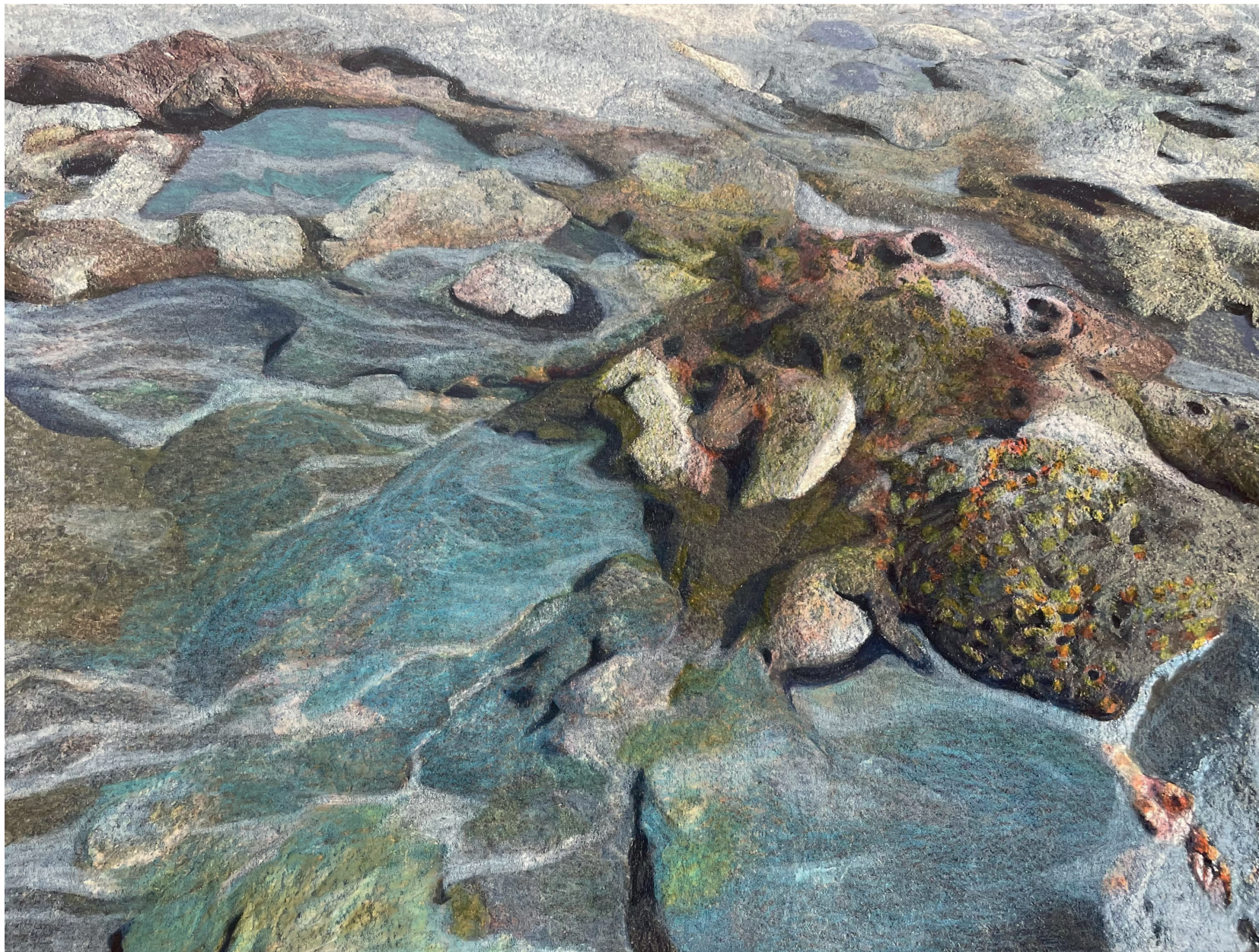
Kosmos XXIX, kleurpotlood op papier gelijmd op dibond, 26 x 19 cm, 2024

kop gezet heeft. Ik ben heel ziek geworden, ik kreeg een hersenbloeding, een bloeding tussen mijn hersenvliezen. Gelukkig had ik geen uitvalverschijnselen, maar gewoon mijn oude leven weer oppakken was uitgesloten, ik moest mijzelf als het ware opnieuw uitvinden. Het is voor mensen met hersenletsel heel moeilijk om zich te verhouden tot de snelle, steeds drukkere wereld om hen heen. Mij lukt dat dus niet meer, ik heb veel rust en stilte nodig.'